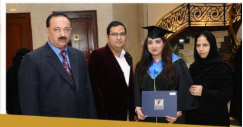
صور من حفل التخرج