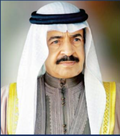
صاحب السمو الملكي الأمير خليفة بن سلمان آل خليفة رئيس مجلس الوزراء