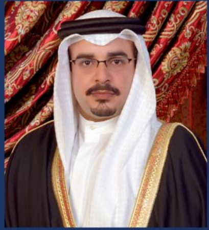
صاحب السمو الملكي الأمير سلمان بن حمد آل خليفة ولي العهد نائب القائد الأعلى والنائب الأول لرئيس مجلس الوزراء