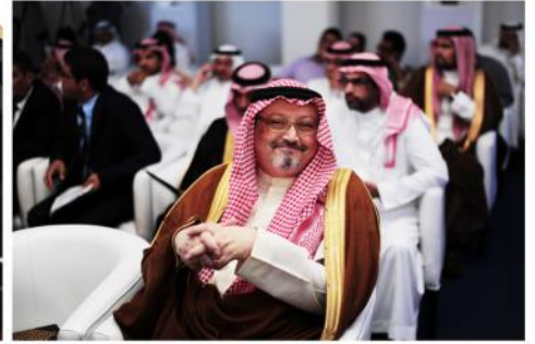
صور من حفل افتتاح مبنى الجامعة