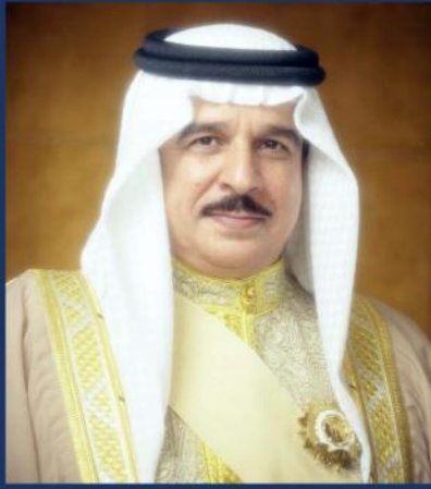
حضرة صاحب الجلالة الملك حمد بن عيسى آل خليفة ملك مملكة البحرين